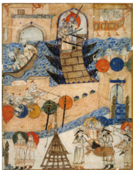
Le siège de Bagdad en 1258 (miniature persane).

A l'évidence, l'Iran peut jouer un rôle majeur. Il ne faut pas oublier que la frontière culturelle entre les deux pays est somme toute, très artificielle. Pendant des siècles, la Mésopotamie a irrigué culturellement l'Iran