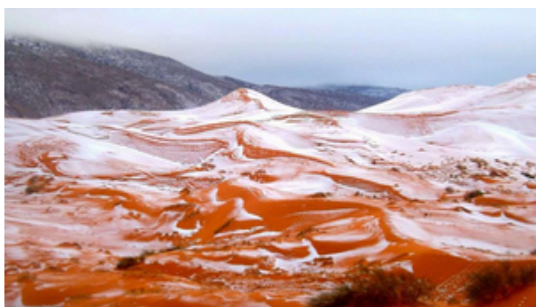
Photo amateur des dunes du Sahara enneigées le 19 décembre 2016 aux alentours de la ville d'Aïn Sefra en Algérie.

C'est un événement météo extrêmement rare. La neige est tombée sur les dunes de sable rouge du Sahara algérien, lundi 19 décembre, comme en témoigne cette série de photos amateur.